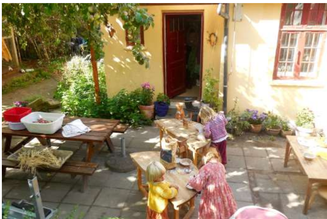
Vi er i gang med at kværne mel af det korn, som vi lige har tærsket.