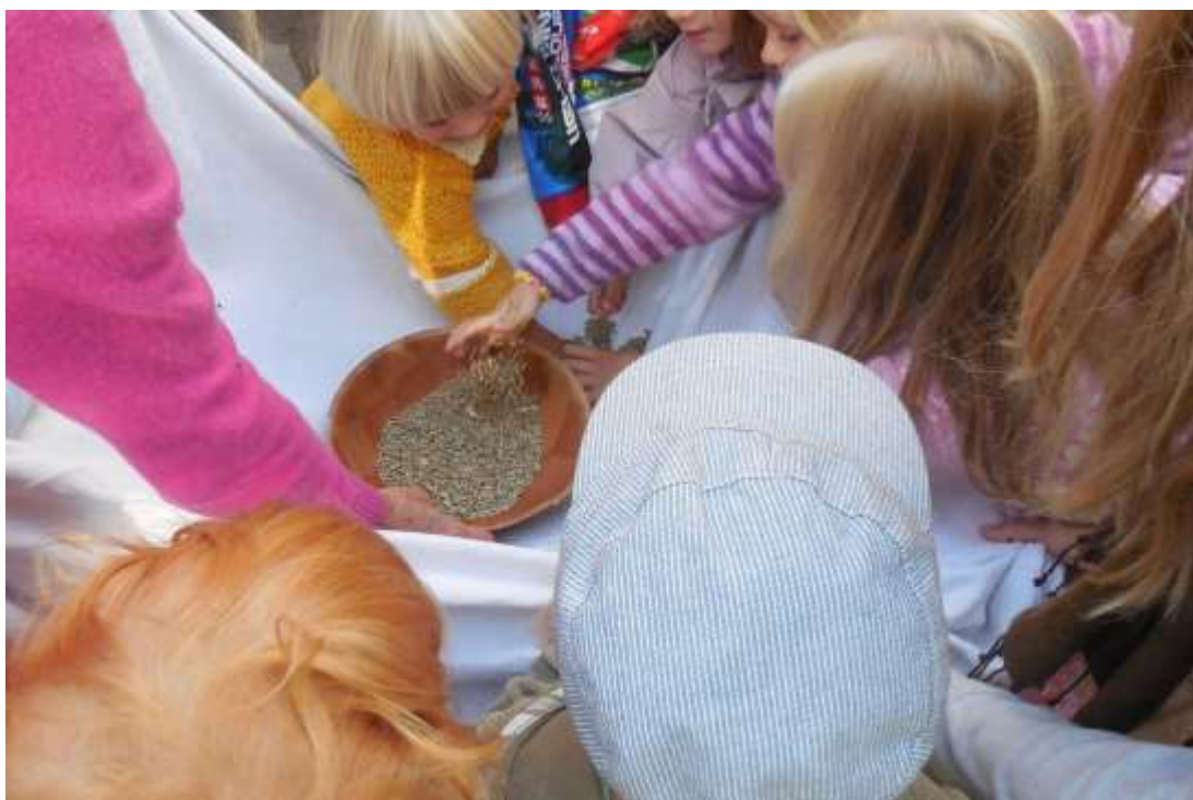
Tærskning før høstfesten